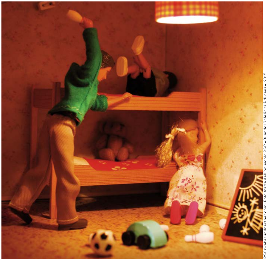
I bambini che vivono situazioni di violenza fra i propri genitori sono sempre vittime di violenza psicologica e sono molto più spesso maltrattati fisicamente rispetto alla media.

soprattutto se la violenza perdura da anni ed ha lasciato segni sia fisici che psichici. Le donne colpite fanno molto per fermare la violenza: si adattano, si sottomettono oppure si difendono e cercano di proteggere se stesse e soprattutto i loro figli. Le donne colpite reprimono però anche molto per sopportare l'impotenza e la vergogna. Accettano le colpe, «scusano» e sperano in un miglioramento, spesso per anni.