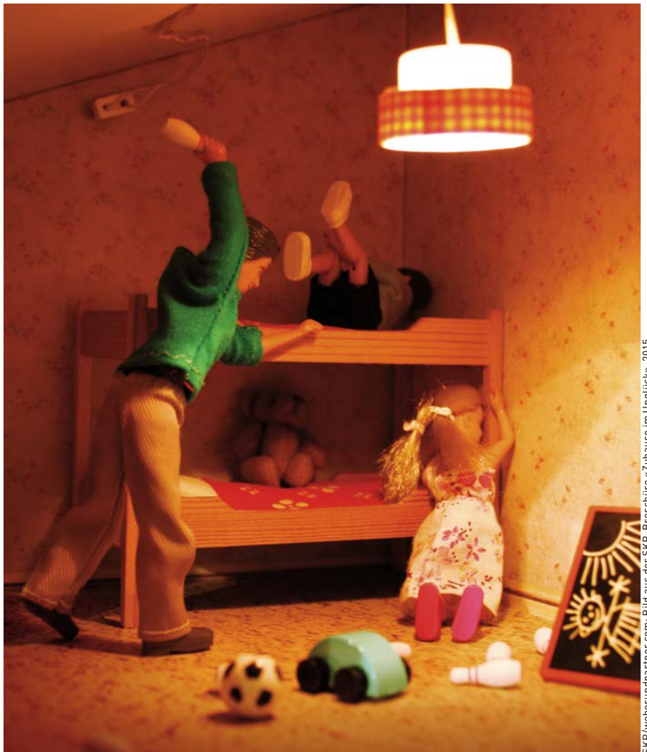
SKP/weberundpartner.com: Bild aus der SKP-Broschüre «Zuhause im Unglück», 2015

Kinder, die Gewalt in der elterlichen Paarbeziehung miterleben, sind immer Opfer von psychischer Gewalt und werden auch überdurchschnittlich häufig körperlich misshandelt.